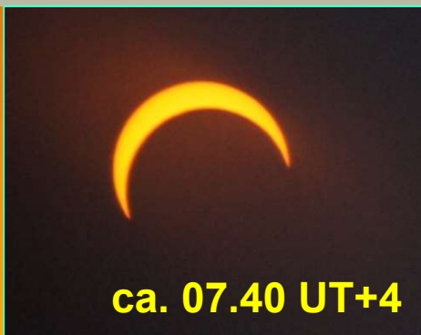
ca. 07.40 UT+4