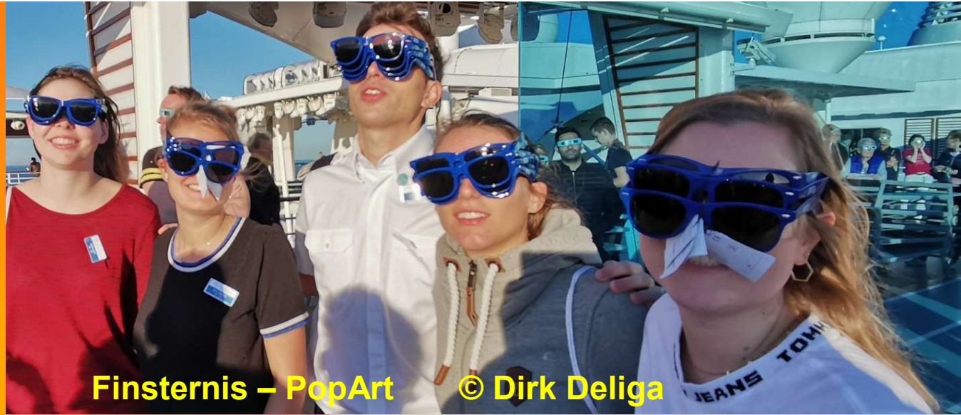
Finsternis – PopArt

26.12.19 Arabisches Meer Magische Momente