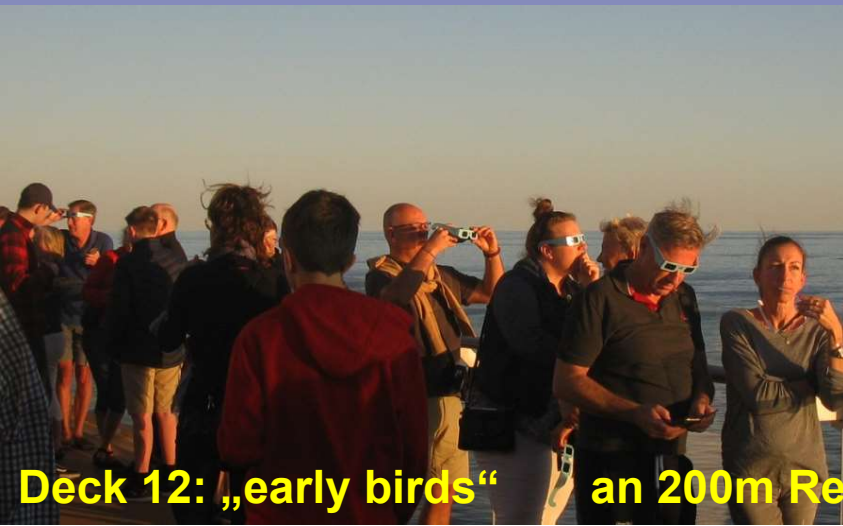
Deck 12: „early birds“ an 200m Reling