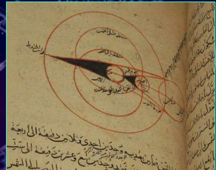
A propos „Finsternisse“, Iran 14. Jhdt., Louvre Abu Dhabi